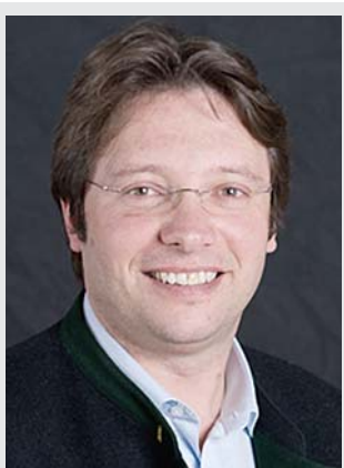
Nicholas Boekdrucker International Marketing & PR: Asia, Eastern Europe, USA, UK & Ireland:

Зона Акзамер Лицум (Axamer Lizum) знаменита тем, что именно тут проходили зимние Олимпиады. Несмотря на огромную популярность (почти каждому прибывающему в Olympia SkiWorld Innsbruck