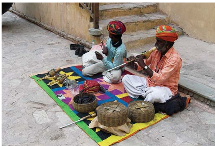
Экзотика: вглубь материков и веков...