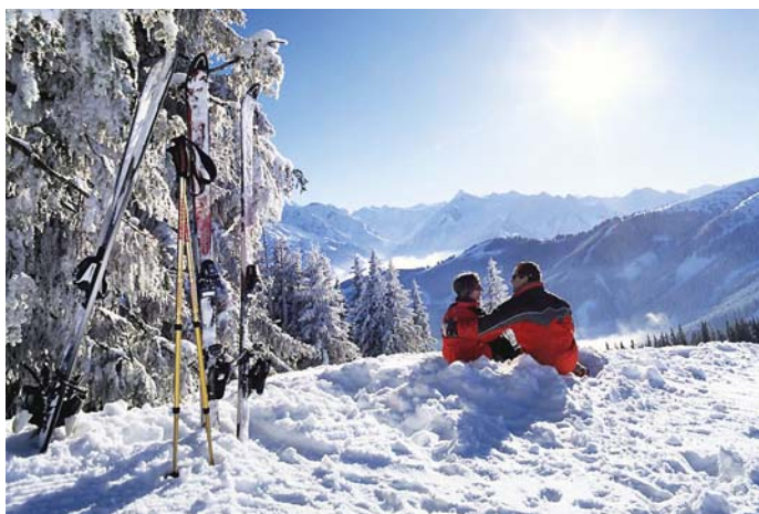
Горные лыжи: в борьбе спроса и предложения побеждает гибкость