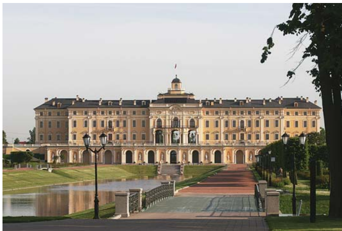
Деловой туризм в Петербурге: ресурсы есть, было бы желание...